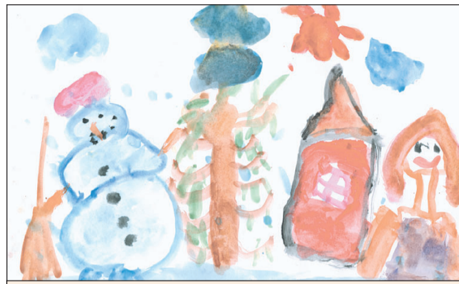
Братчикова Лиза, 5 лет, КГКУ «КрУДор»